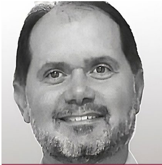
Roth: A falta de domínio sobre os resultados financeiros é a principal falha cometida pelo empresário na hora de ajustar o orçamento

“A partir disso, podemos mencionar alguns questionamentos: a empresa possui