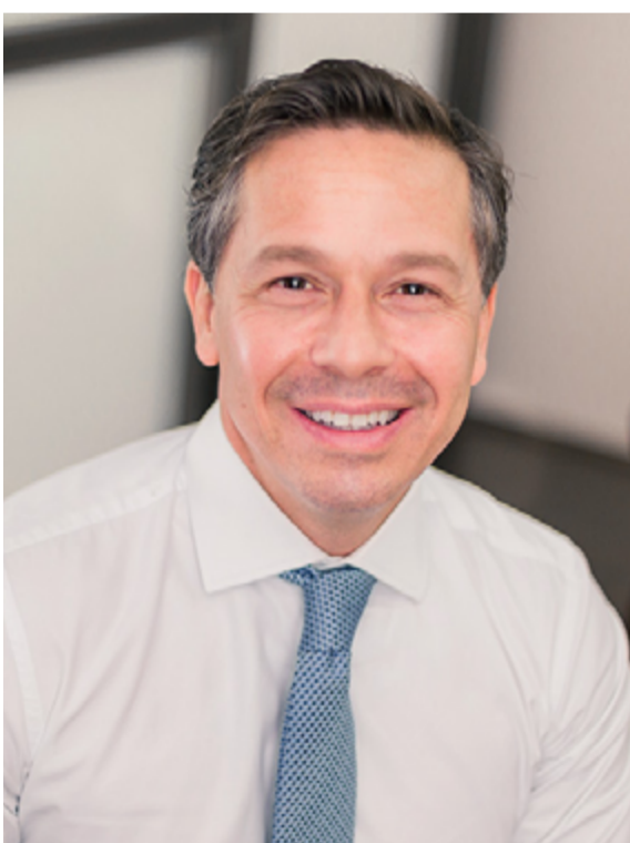
Natal: “Há necessidade de conceder mais alívio, de forma abrangente, para a recuperação em médio e longo prazos”

A primeira possibilita que as empresas flexibilizem a concessão de férias, podendo antecipá-las até mesmo nos casos dos trabalhadores que ainda não têm o direito adquirido. “Outro mecanismo dessa MP é que